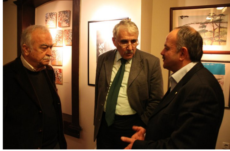
Sivas, Zonguldak ve Malatya temsilcilerimiz...