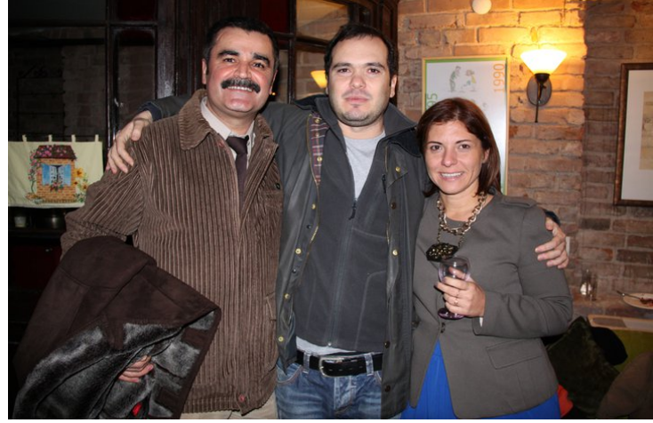
Edirne temsilcimiz (solda)