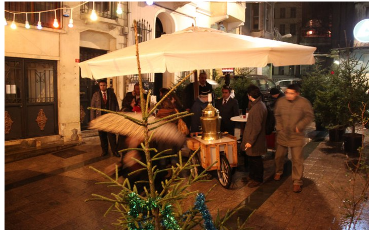
Sokak partisinde salep içerek ısındık...